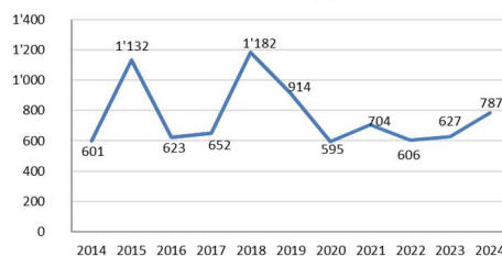
Nombre d'habitants supplémentaires

La région reste en croissance, mais d'une valeur médiane depuis la création du SDIS Nyon-Dôle. Avec la mise à jour des chiffres de 2024, sur l'ensemble des 18 communes du SDIS Nyon-Dôle, nous comptons 787 nouveaux habitants, ce qui représente un total de 50'323 habitants qui génèrent une recette supplémentaire d'environ CHF 33'054.-.